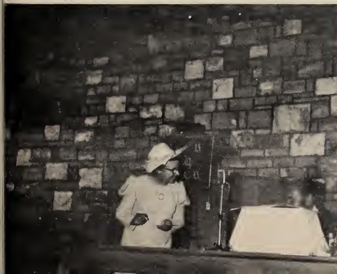
... So het ons fees gevier.